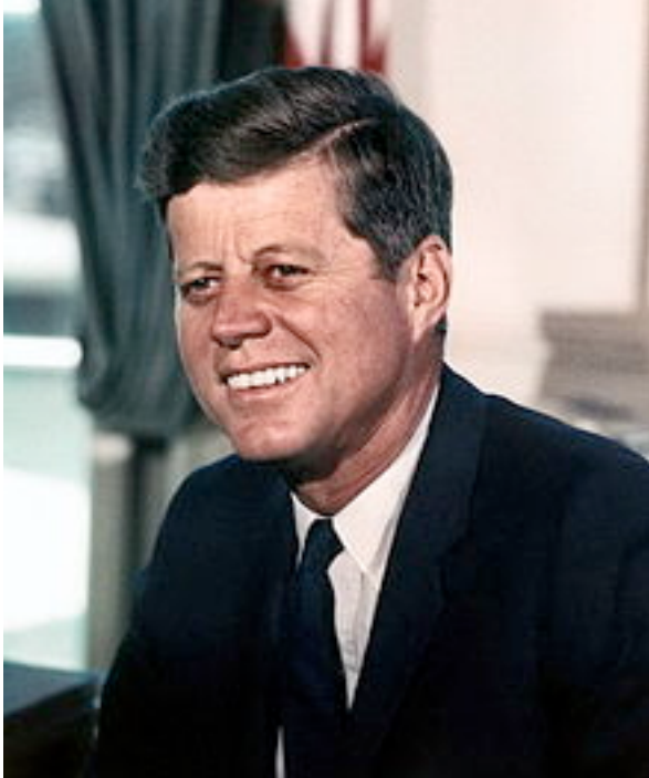
JFK : assassinat à Dallas Texas

2. Que se passe t'-il en 1963 ? Assassinat de JFK à Dallas (Texas)