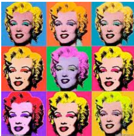
Andy Warhol Marilyn Monroe

Un comic est un terme utilisé aux Etats-Unis pour désigner une bande dessinée. Il est presque devenu synonyme de bande dessinée de super-héros. Exemples : Iron-Man ; Les X-Men ; Daredevil ; Wolverine ; Superman.