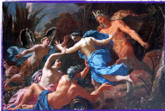
Michel Dorigny, Pan et Syrinx , 1657

- d'autres peintres ont choisi d'illustrer cette métamorphose de Syrinx, tout en choisissant plusieurs moments différents.